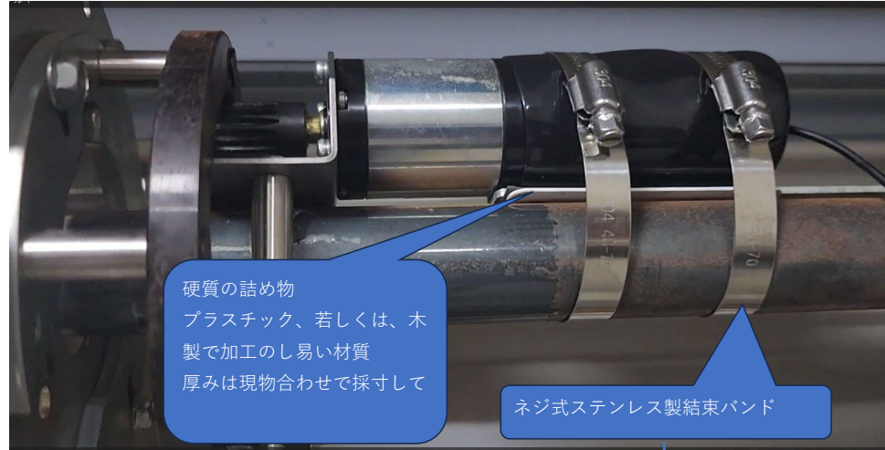
対策施工後 施工前とモーター取付位置は逆ですが、方法は同じです

硬質の詰め物 プラスチック、若しくは、木製で加工のし易い材質 厚みは現物合わせで採寸して