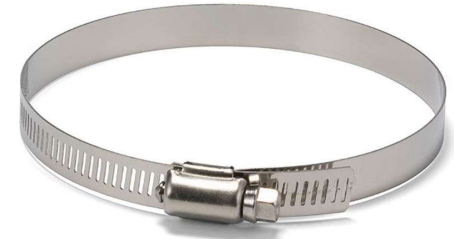
幅1cm程度のねじ式ステンレス製結束バンド